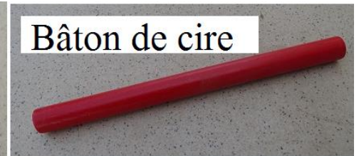
Bâton de cire